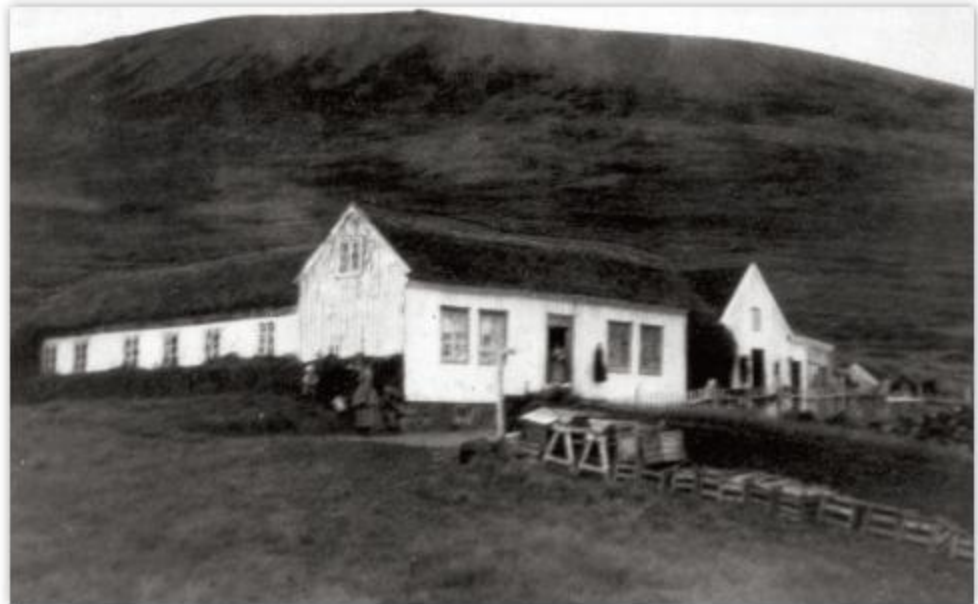
Heiði í Hönguskörðum 1921.