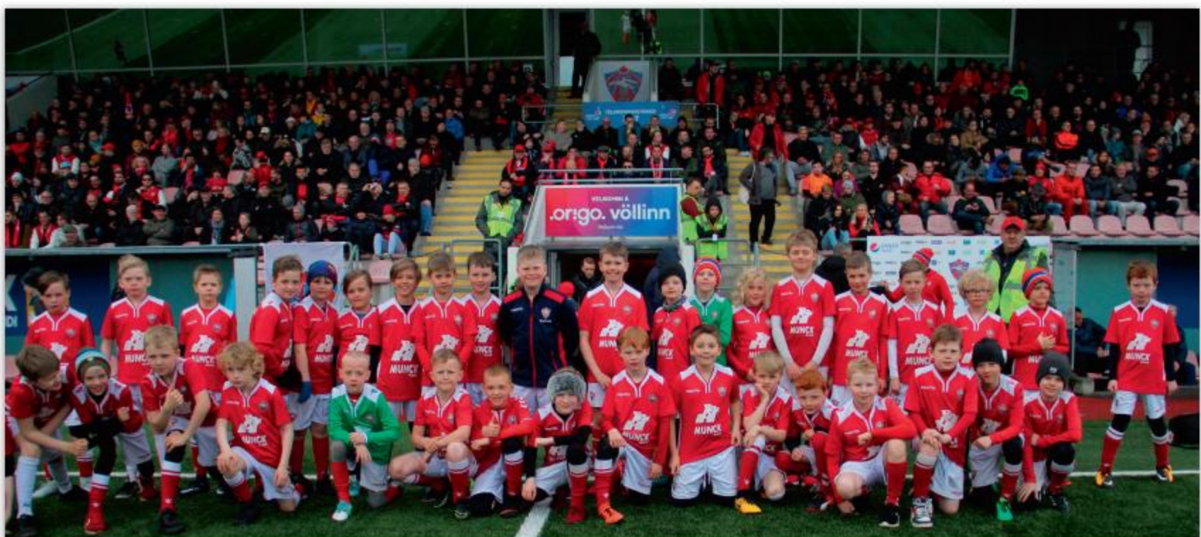
6. flokkur drengja í fótbolta. Myndin er tekin fyrir leik Vals og Fylkis í knattspyrnu, 13. maí 2018.