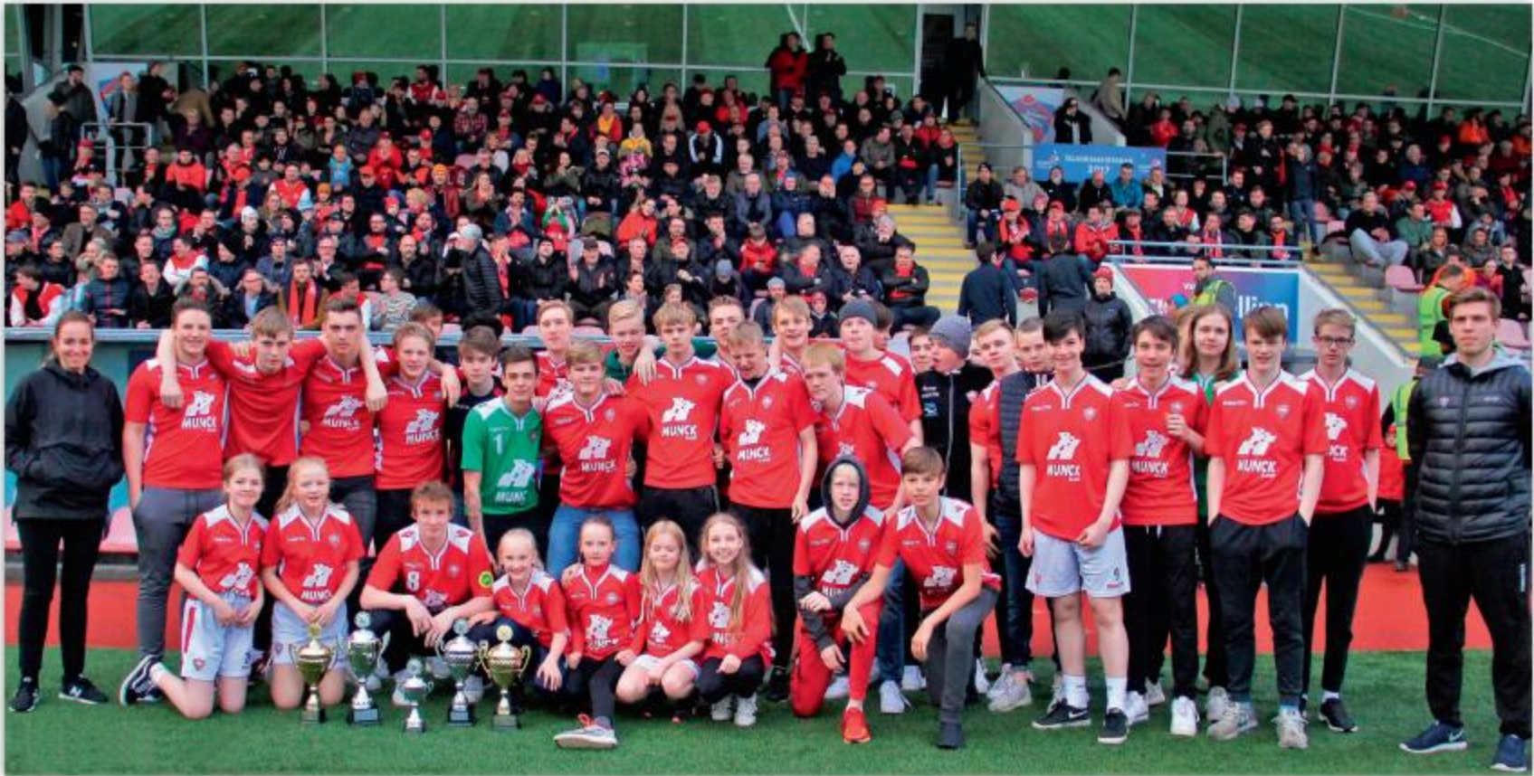
Íðkendur í fjórum Íslandsmeistaraliðum Vals í handbolta. Myndin er tekin fyrir leik Vals og Fylkis í knattspyrnu, 13. maí 2018.

irnir að vera komnir kl. 9 1/2 um morguninn niður í KFUM; allir áttu að hafa skriflegt leyfi með sér að heiman og fékk enginn að fara með án þess. Veðrið var ekki upp á það besta og þótti tvísýnt um hvort fara bæri, samt var það afráðið og lagði nú allur herinn af stað. Fyrst kom blaktandi nýi fáninn og síðan 40 piltar úr A-D og U-D. Svo komu drengirnir úr Y-D og voru þeir liðlega 200. Sveitastjórnarnir fylgdu hver sinni sveit, gengu fjórir saman í röð. Var þetta allásjáleg fylking. Var nú gengið alla leið til Hafnarfjarðar og hvílt einu sinni litla stund á leiðinni.