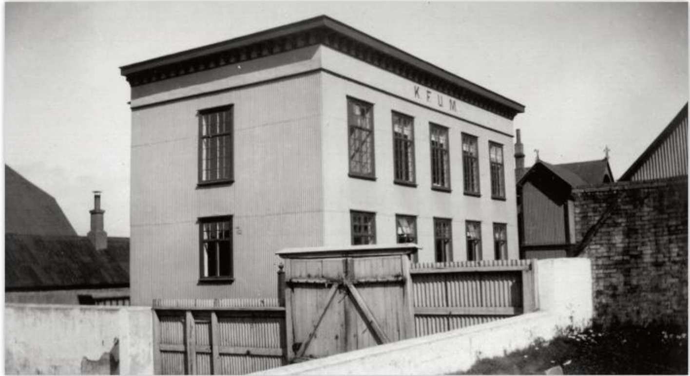
Hús KFUM við Amtmannsstíg.