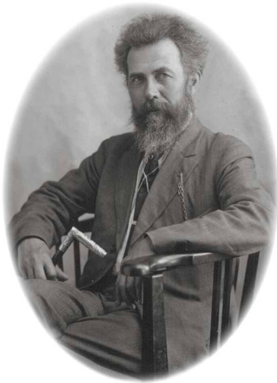
Séra Friðrik í Ameríku 1915 – með yfirlætisstaf.