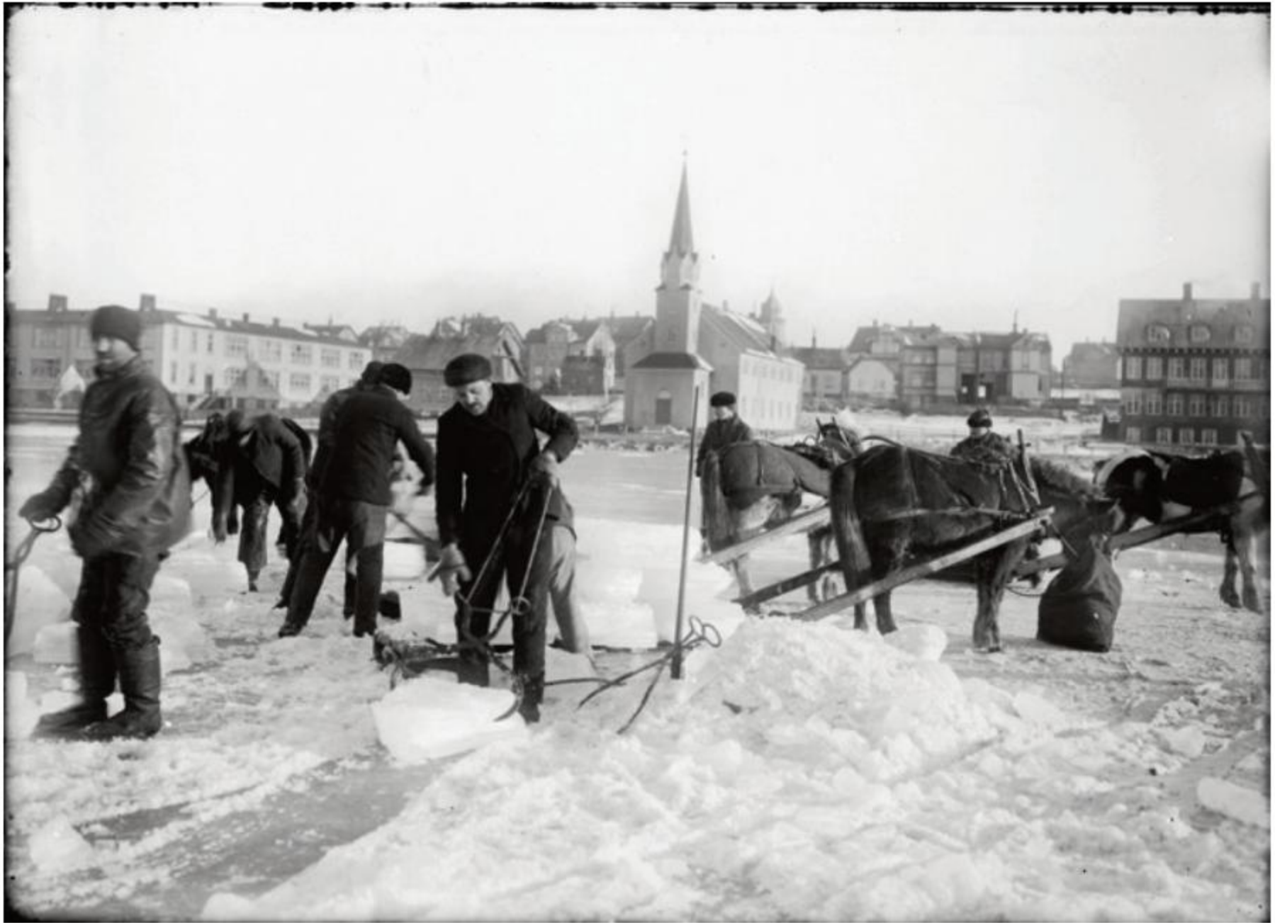
Ístaka á Tjörninni í Reykjavík.

var átakanlegur tími. Þetta stóð yfir mest kringum sunnudaginn þann 24. nóv.