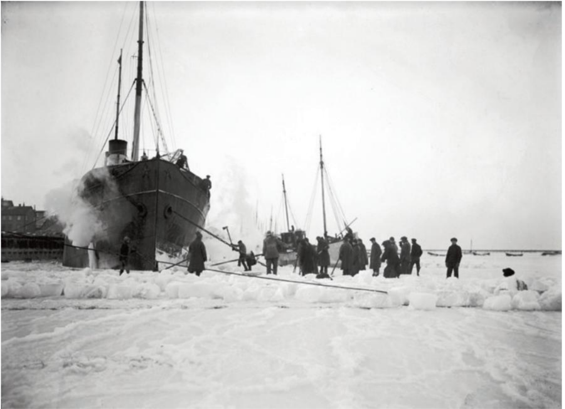
Miðbakk, Reykjavíkurhöfn. Frostaveturinn mikli. Verið að höggva og saga ís við strandferðaskipið Sterling til þess að ná því lausu úr ísnum. Ljósmyndari. Magnús Ólafsson (1862–1937).

Þess má geta að KFUM-húsið var ólæst bæði nótt og dag allan þennan tíma. –Ég kenndi mér einskis meins og hef ekki fengið hjartslátt síðan.